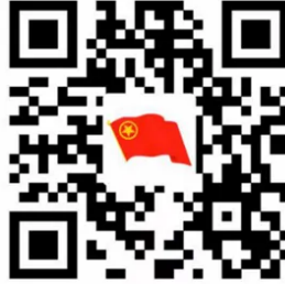
团员在线报到二维码

登录“智慧团建”账号，扫描以下二维码（或从“广东共青团”、“广东青年之声”公众号进入）